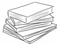
Evidens og materialer