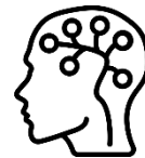
Mental og fysisk sundhed