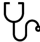
Lighed i sundhed